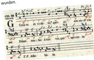
NB18a Graduale Triplex , S. 303

restituieren: einen früheren Zustand wieder herstellen