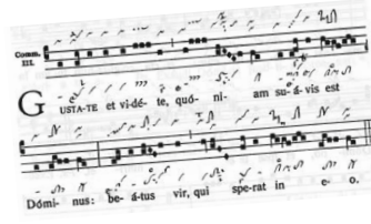
NB18b Graduale Novum , Band I, S. 283