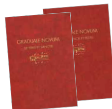
Graduale Novum , 2 Bände (ConBrio Verlagsgesellschaft, Regensburg 2011/2018)

Im Gegensatz zum Graduale Triplex war im Graduale Novum der Abdruck der beim wichtigsten Neumennotationen aus St. Gallen und Metz von Anfang an geplant (→ S. 90). Daher musste diesmal nicht zur besseren Lesbarkeit eine Handschrift in rot gedruckt werden, sondern der Abstand der Notenzeilen wurde so gewählt, in rot gedruckt werden, sondern der Abstand der Notenzeilen wurde so gewählt, dass die beiden Handschriften gut lesbar eingefügt werden konnten. Wie schon im Graduale Triplex wurde jede einzelne Neume handschriftlich mit einer Tuschefeder in das Druckmanuskript eingetragen. Johannes Berchmans Göschl, Mitherausgeber des Graduale Novum , hat dieses an handwerklicher Präzision nicht zu überbietende Meisterwerk erstellt. Dass dadurch der Platzbedarf größer wurde, liegt auf der Hand. Dies ist auch der Grund, warum die Gesänge nun auf zwei Bücher aufgeteilt wurden.